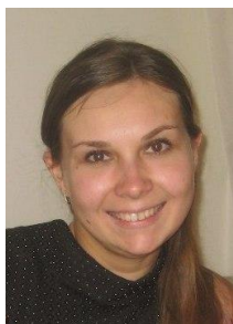
Главный хронометрист СС3К