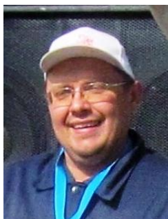
Заместитель руководителя гонки по маршруту и безопасности СС2К