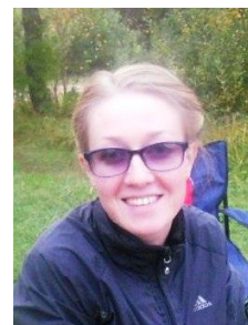
Офицер по связи с участниками СС2К