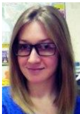
Судья при участниках