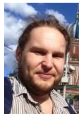
Старший технический контролер